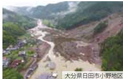
大分県日田市小野地区