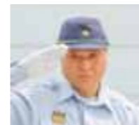
総監を務める 福田富一 栃木県知事

平成29年8月27日、大田原市中田原工業団地（那須赤十字病院隣）で開催した、栃木県・大田原市防災訓練には、福田富一栃木県知事、津久井富雄大田原市長など各機関トップの方々のご出席をはじめ、国・県・市等の行政機関や地元消防団、関係団体、関係機関など、89団体・約1,400名が参加し、本番さながらの訓練が行われました。