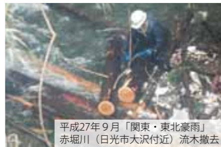
平成27年9月「関東・東北豪雨」 赤堀川（日光市大沢付近）流木撤去