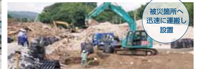
被災箇所へ 迅速に運搬し 設置

大型土のうは、普通の土のうが流されてしまう様な流れの強い所に土のうを設置する場合などに威力を発揮します。栃木県建設業協会から大型土のう簡易製作機を、九州北部豪雨の被災地へ運搬し作成した大型土のうは、被災現場の早期復旧に貢献しました。