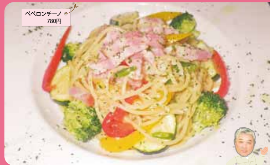
ペペロンチーノ 780円