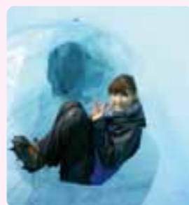
英語を活かした海外旅行 (NZのフォックス氷河登山)