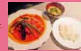
チキンのトマトソース煮 950円

JR足利駅北口前にある洒落たレストランで、店内にはママさんが作っているブリザードフラワーがたくさん飾ってあり、素敵な雰囲気!料理は家庭的でバランスの整ったフレッシュでやさしい味が魅力です!