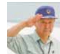
訓練本部長を務める 津久井富雄 大田原市長