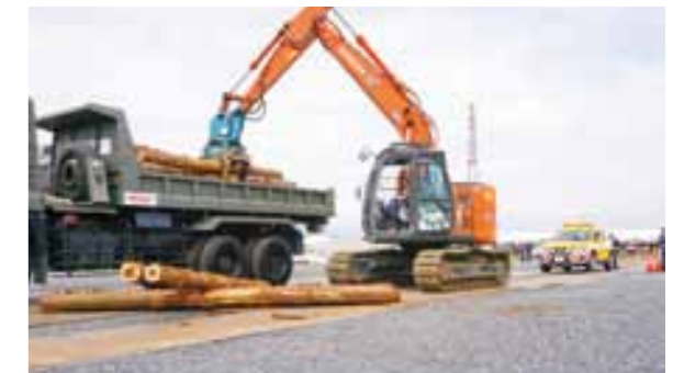
栃木県建設業協会 那須支部等による 『道路啓開訓練』陸上自衛隊の車両に瓦礫を載せる撤去作業