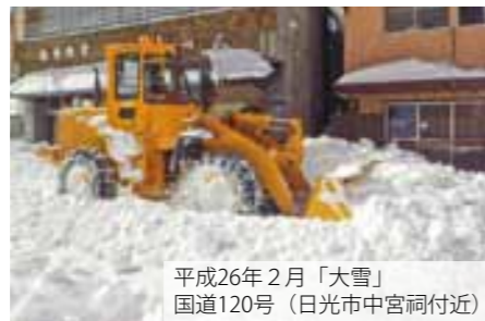
平成26年2月「大雪」 国道120号（日光市中宮祠付近）