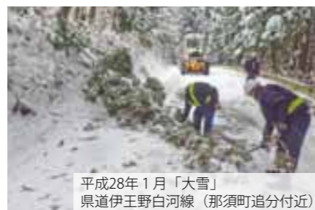
平成28年1月「大雪」 県道伊王野白河線（那須町追分付近）