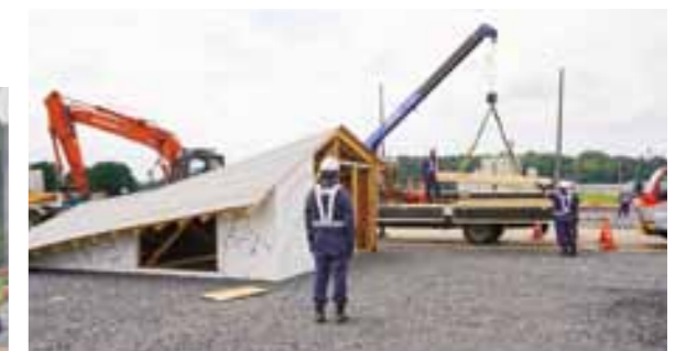
栃木県建設業協会 那須支部等による 『瓦礫等除去訓練』救助・救援活動を妨げる倒壊家屋などの撤去作業