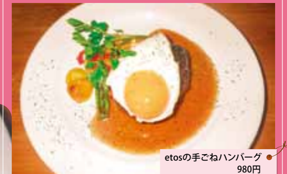
etosの手ごねハンバーグ 980円 (トッピング目玉焼き) 100円