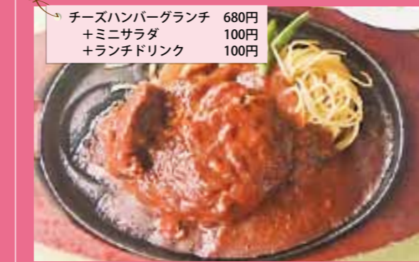
チーズハンバーグランチ 680円 +ミニサラダ 100円 +ランチドリンク 100円