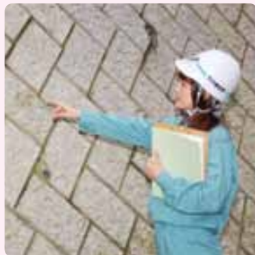
現場にて細部の出来栄をチェック中

私は大学を卒業後、得意な英語を活かして羽田空港に勤務していました。建設業とは全く異なる業界にいましたが、少しでも両親の力になればと思い転職しました。