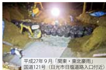
平成27年9月「関東・東北豪雨」 国道121号（日光市日塩道路入口付近）