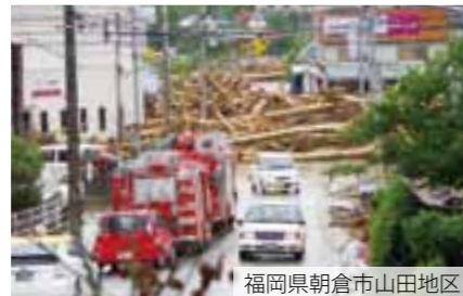
福岡県朝倉市山田地区

平成29年7月5日、昼頃から夜にかけて九州北部で局地的に非常に激しい雨が降り、福岡県・大分県に九州地方では初めての大雨特別警報が発令。24時間の解析雨量は、福岡県朝倉市で約1,000mm、大分県日田市で約600mmの記録的豪雨となり、各地で甚大な被害が発生しました。