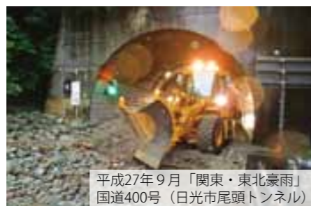
平成27年9月「関東・東北豪雨」 国道400号（日光市尾頭トンネル）