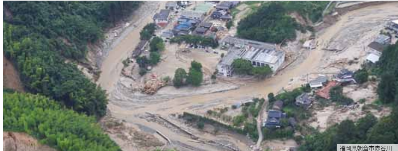
福岡県朝倉市赤谷川

平成29年7月5日、昼頃から夜にかけて九州北部で局地的に非常に激しい雨が降り、福岡県・大分県に九州地方では初めての大雨特別警報が発令。24時間の解析雨量は、福岡県朝倉市で約1,000mm、大分県日田市で約600mmの記録的豪雨となり、各地で甚大な被害が発生しました。