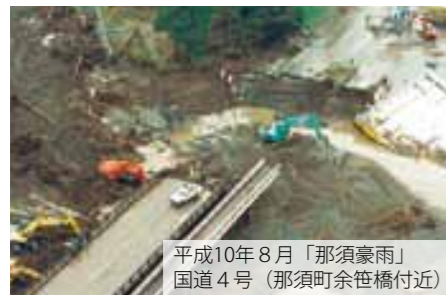
平成10年8月「那須豪雨」 国道4号（那須町余笹橋付近）

栃木県建設業協会では、国や栃木県等との災害協定に基づき組織力や機動力を活かし、異常気象時のパトロールや緊急出動を始め『地域の守り手』として県等の補完機能を果たしています。