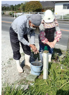
作業場所での手洗い励行