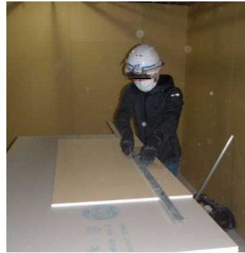
作業時のマスク着用