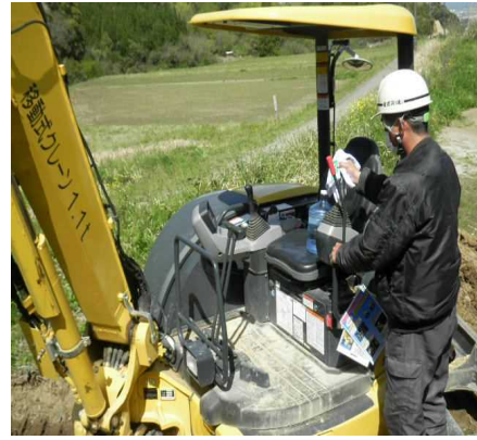
重機のレバーはこまめに消毒