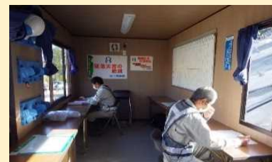
現場事務所での対人間隔の確保と換気