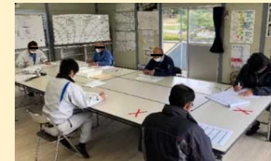
打合せ時の十分な対面距離の確保