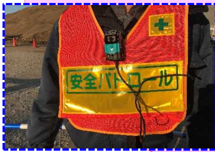
携帯Webカメラ着用状況