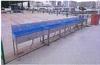
現場の手洗い場所の増設