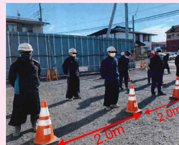
作業員間の一定距離の確保