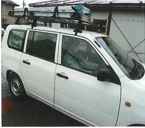
現場移動では同乗を避けて 個人で移動