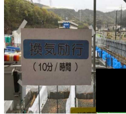
作業場所は定期的に換気する