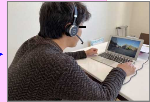
テレワークでの現場確認状況