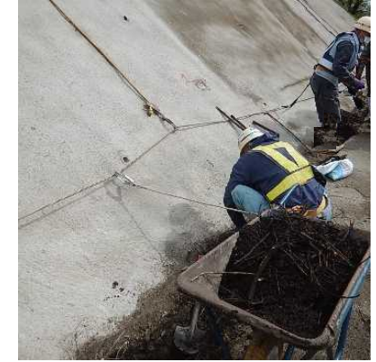
作業時なるべく離隔を確保