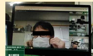
Web会議による打合せ