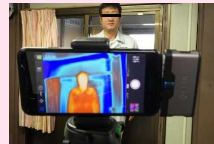
サーモグラフィカメラによる体温計測