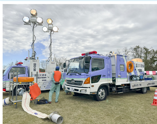
国土交通省下館河川事務所には緊急時の排水ポンプや照明車を展示していただき、その役割や大切さを子どもたちに説明