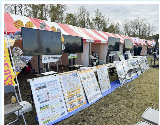
栃木県土整備部からは河川課・交通政策課・道路整備課・建築課に参加いただき、子どもたちに建設事業の説明を実施