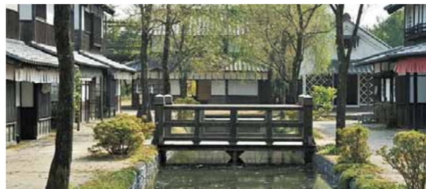
▲日光市：EDO WONDERLAND 日光江戸村

幕末の江戸へタイムスリップしてしまった脳外科医・南方仁が人々の命を救っていく姿を描いて大ヒットしたテレビドラマ。日光江戸村ほか県内各地でロケが行われました。