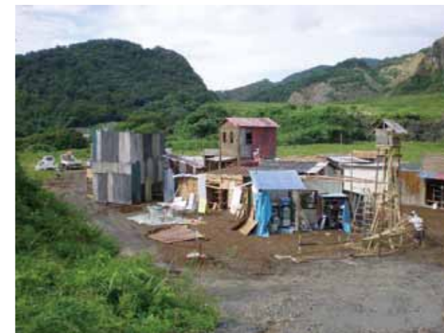
▲岩舟町：岩船山中腹採石場跡 (オープンセット)