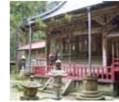
▲鹿沼市：加蘇山神社

【ロケ地】 日光市：日光江戸村、二社一寺 鹿沼市：加蘇山神社 栃木市：塚田歴史伝説館、白石家戸長屋敷 小山市：若駒酒造 塩谷町：鬼怒川 茂木町：那珂川