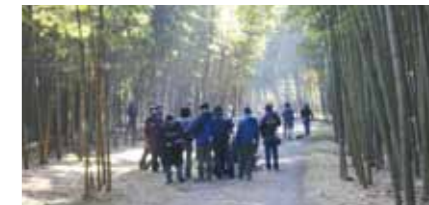
▲宇都宮市：若山農場 (撮影の様子)