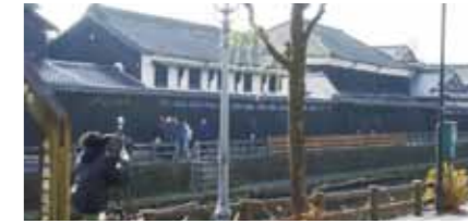
▲栃木市：塚田歴史伝説館 (撮影の様子)