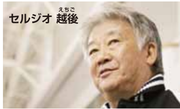
セルジオ 越後 H.C. 栃木日光アイスバックス シニアディレクター

かつて私は「サッカーの伝道師」として、全国をまわり約50万人の子どもたちにサッカーの楽しさを伝えてきました。今度はアイスホッケーを出発点にできないかと考えています。ホッケーの広がりやホッケーだけにとどめない。サッカーの広がりやサッカーだけにとどめない。これは小さな第一歩です。けれど、新しい地平を目指すスタートです。セルジオ越後とともに、そのスタートラインに並んでください。よろしくお祈りします。