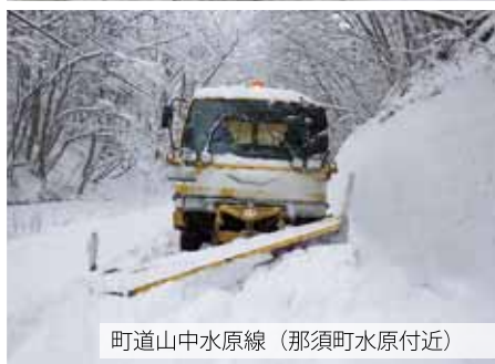
町道山中水原線（那須町水原付近）