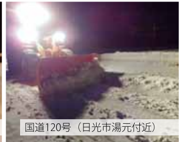
国道120号（日光市湯元付近）