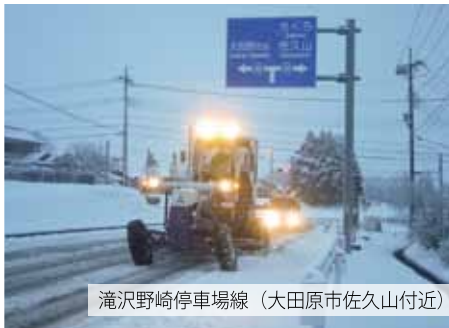
滝沢野崎停車場線（大田原市佐久山付近）