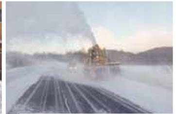
国道120号（日光市中宮祠戦場ヶ原付近）