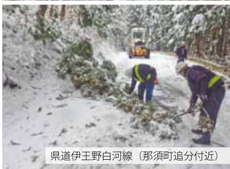
県道伊王野白河線（那須町追分付近）