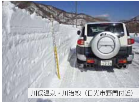
川俣温泉・川治線（日光市野門付近）