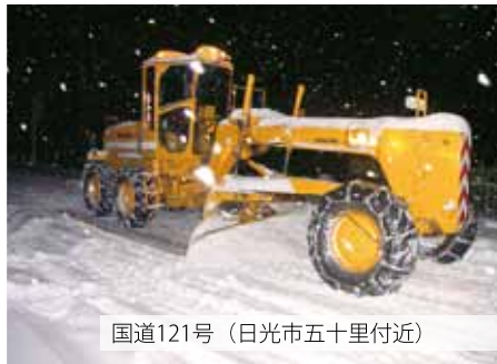
国道121号（日光市五十里付近）