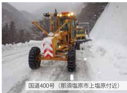
国道400号（那須塩原市上塩原付近）