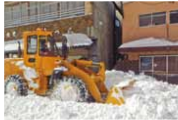
国道120号（日光市中宮祠付近）