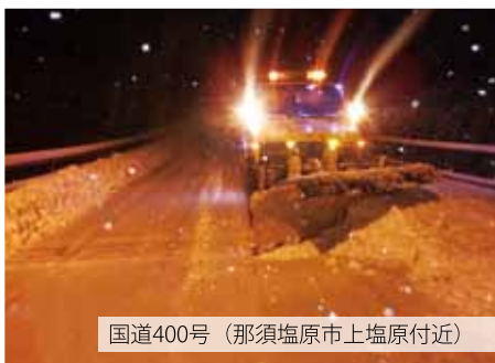
国道400号（那須塩原市上塩原付近）