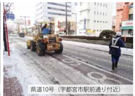
県道10号（宇都宮市駅前通り付近）