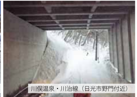
川俣温泉・川治線（日光市野門付近）