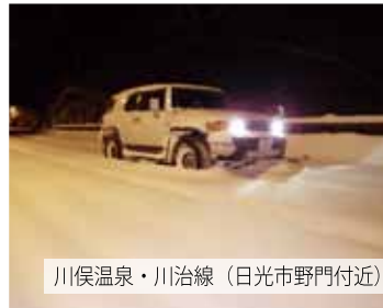
川俣温泉・川治線（日光市野門付近）