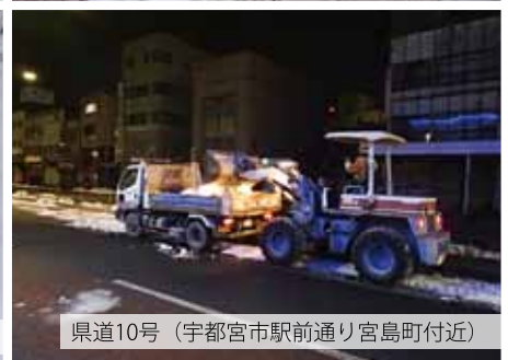
県道10号（宇都宮市駅前通り宮島町付近）