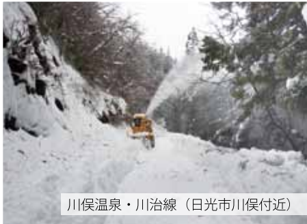
川俣温泉・川治線（日光市川俣付近）