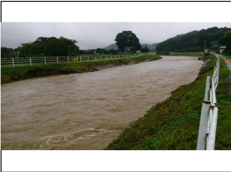
9月10日 10:36:30 右岸12m左岸9m