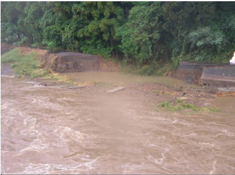
9月10日 18:56:32 姿川 姿橋上流堤防崩壊