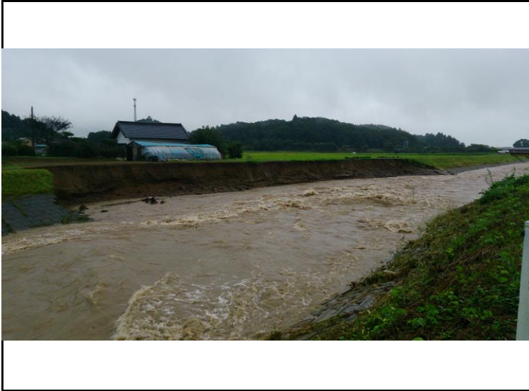
赤津川国道293国道脇谷橋下流 9月10日 10:24:46 左岸側約70m崩壊