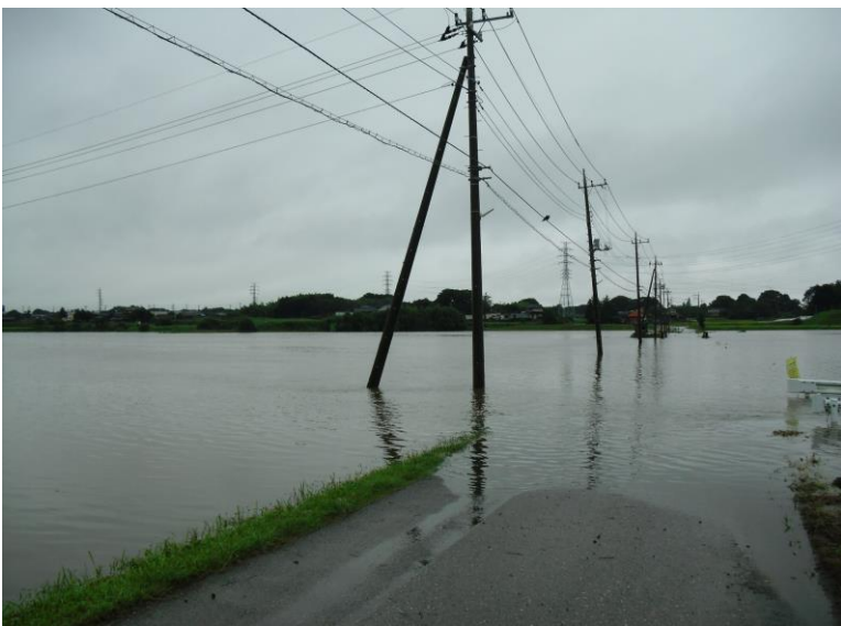
蓮花川 学童橋 9月10日 10:56:42 道路冠水