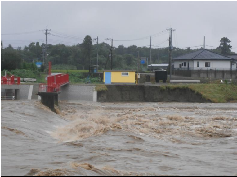
壬生町 9月10日 18:18:59 堤防崩壊