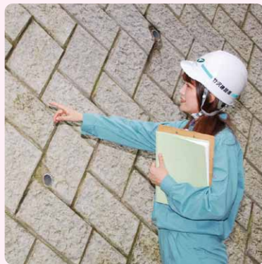
現場にて細部の出来栄をチェック中

私は大学を卒業後、得意な英語を活かして羽田空港に勤務していました。建設業とは全く異なる業界にいましたが、少しでも両親の力になればと思い転職しました。