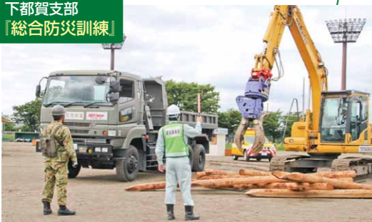
下都賀支部 「総合防災訓練」