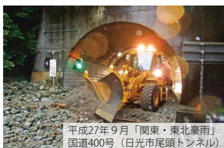
平成27年9月「関東・東北豪雨」 国道400号（日光市尾頭トンネル）