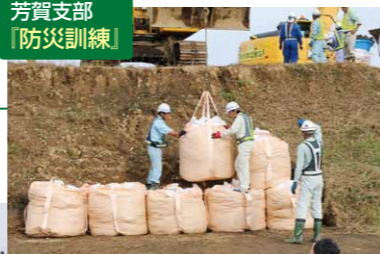
芳賀支部 「防災訓練」