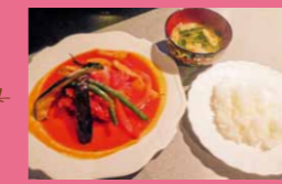
チキンの トマトソース煮 950円

JR足利駅北口前にある洒落たレストランで、店内にはママさんが作っているブリザードフラワーがたくさん飾ってあり、素敵な雰囲気!料理は家庭的でバランスの整ったフレッシュでやさしい味が魅力です!