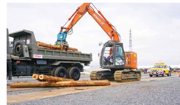
栃木県建設業協会 那須支部等による 『道路啓開訓練』陸上自衛隊の車両に瓦礫を載せる撤去作業