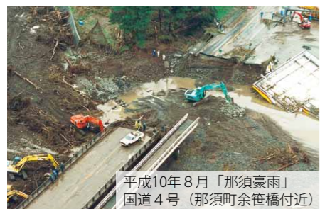
平成10年8月「那須豪雨」 国道4号（那須町余笹橋付近）

栃木県建設業協会では、国や栃木県等との災害協定に基づき組織力や機動力を活かし、異常気象時のパトロールや緊急出動を始め『地域の守り手』として県等の補完機能を果たしています。