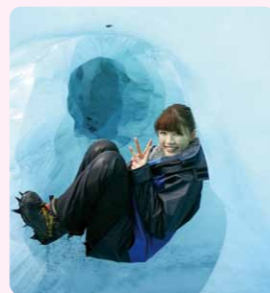
英語を活かした海外旅行 (NZのフォックス氷河登山)