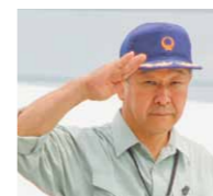
訓練本部長を務める 津久井富雄 大田原市長