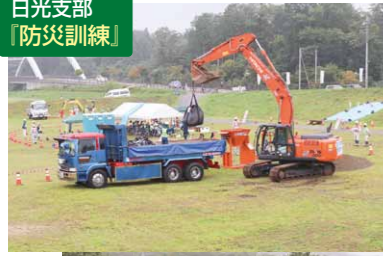
日光支部 「防災訓練」