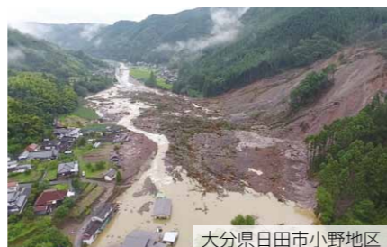
大分県日田市小野地区