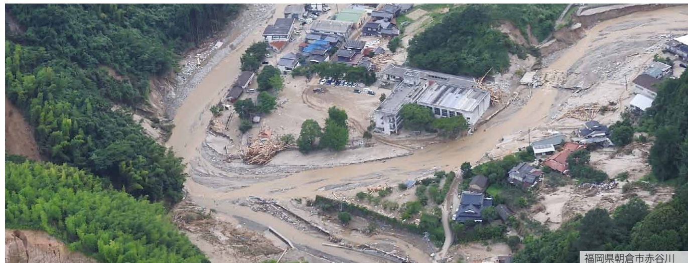
福岡県朝倉市赤谷川

平成29年7月5日、昼頃から夜にかけて九州北部で局地的に非常に激しい雨が降り、福岡県・大分県に九州地方では初めての大雨特別警報が発令。24時間の解析雨量は、福岡県朝倉市で約1,000mm、大分県日田市で約600mmの記録的豪雨となり、各地で甚大な被害が発生しました。