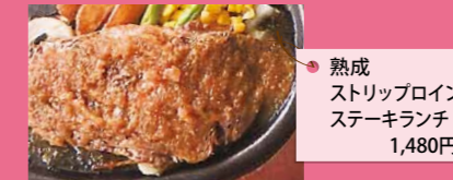
熟成 ストリップロイン ステーキランチ 1,480円

ステーキ・ハンバーグのどんさん亭としての営業は30年になります。ランチには、スープ・ライス(白米・穀米・たき込みご飯・パンから選べます)が付いて値段も安く、味も良く、みんなに愛されているお店です!