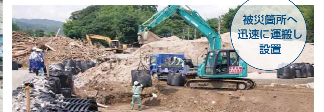
被災箇所へ 迅速に運搬し 設置

大型土のうは、普通の土のうが流されてしまう様な流れの強い所に土のうを設置する場合などに威力を発揮します。栃木県建設業協会から大型土のう簡易製作機を、九州北部豪雨の被災地へ運搬し作成した大型土のうは、被災現場の早期復旧に貢献しました。