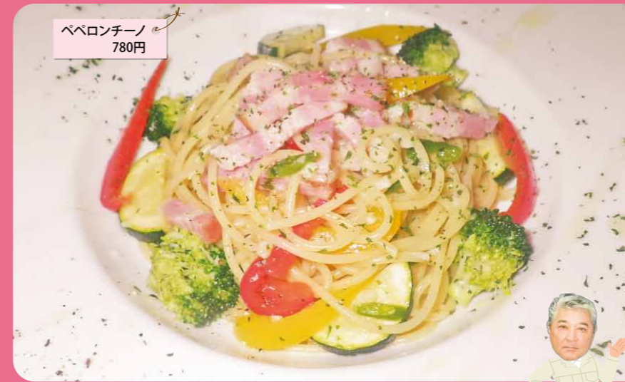
ペペロンチーノ 780円