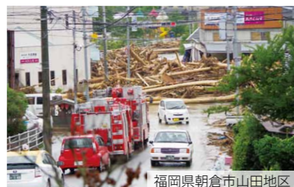
福岡県朝倉市山田地区

平成29年7月5日、昼頃から夜にかけて九州北部で局地的に非常に激しい雨が降り、福岡県・大分県に九州地方では初めての大雨特別警報が発令。24時間の解析雨量は、福岡県朝倉市で約1,000mm、大分県日田市で約600mmの記録的豪雨となり、各地で甚大な被害が発生しました。