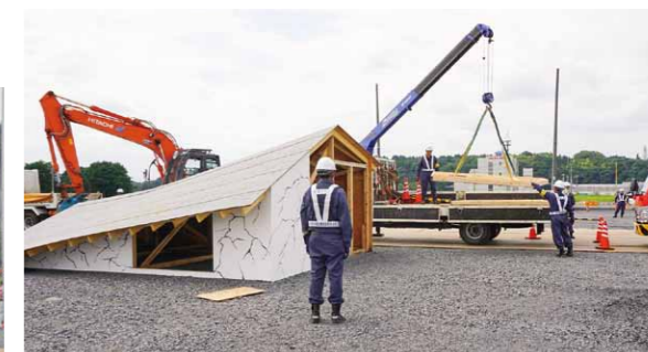
栃木県建設業協会 那須支部等による 『瓦礫等除去訓練』救助・救援活動を妨げる倒壊家屋などの撤去作業