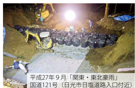
平成27年9月「関東・東北豪雨」 国道121号（日光市日塩道路入口付近）