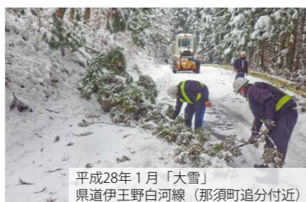
平成28年1月「大雪」 県道伊王野白河線（那須町追分付近）