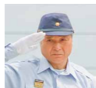
総監を務める 福田富一 栃木県知事

平成29年8月27日、大田原市中田原工業団地（那須赤十字病院隣）で開催した、栃木県・大田原市防災訓練には、福田富一栃木県知事、津久井富雄大田原市長など各機関トップの方々のご出席をはじめ、国・県・市等の行政機関や地元消防団、関係団体、関係機関など、89団体・約1,400名が参加し、本番さながらの訓練が行われました。