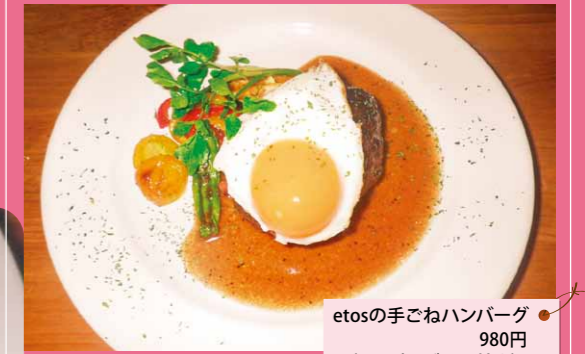
etosの手ごねハンバーグ 980円 (トッピング目玉焼き) 100円