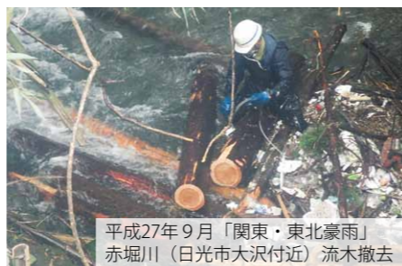
平成27年9月「関東・東北豪雨」 赤堀川（日光市大沢付近） 流木撤去