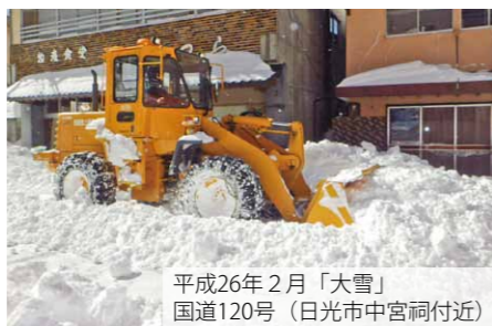
平成26年2月「大雪」 国道120号（日光市中宮祠付近）