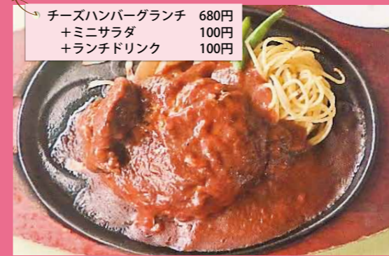
チーズハンバーグランチ 680円 +ミニサラダ 100円 +ランチドリンク 100円