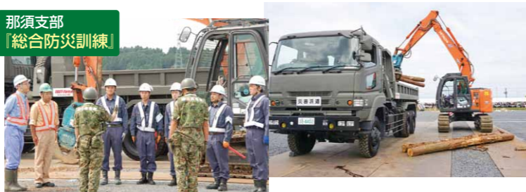
那須支部 「総合防災訓練」