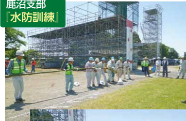
鹿沼支部 「水防訓練」