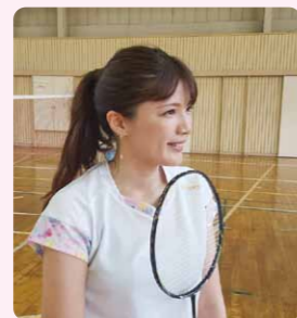
趣味はバドミントンです♡