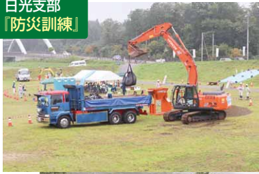
日光支部 『防災訓練』

【情報伝達訓練】 道路河川等管理情報システム※を活用した情報共有・被害状況伝達訓練