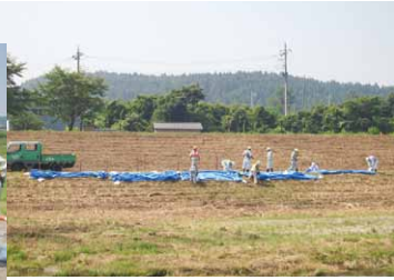
那須支部 『総合防災訓練』