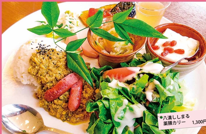
●八溝ししまる 薬膳カレー 1,300円