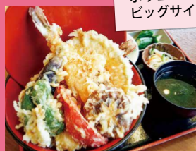
●ボリューム満点！ ビッグサイズ天丼 1,600円