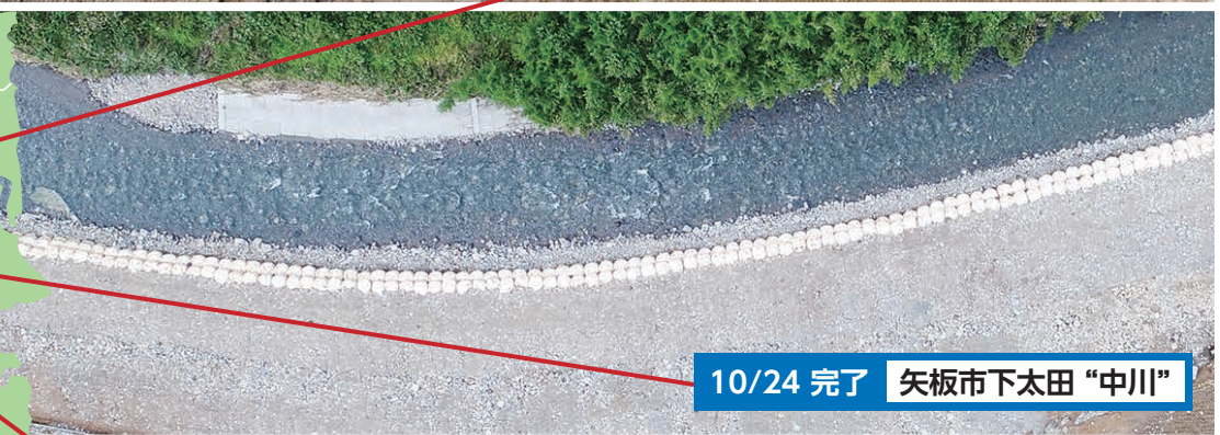
10/24 完了 矢板市下太田 "中川"