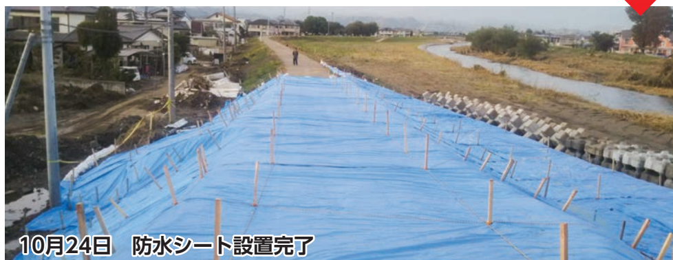
10月24日 防水シート設置完了

佐野市赤坂町の海陸橋近くの「秋山川」が決壊。安蘇支部会員企業が、昼夜を問わず迅速な対応により住宅地へ流れ込む水流の侵入防止措置を行う。再び雨脚が強くなる前に応急対応が完了し、防水シートを覆った。