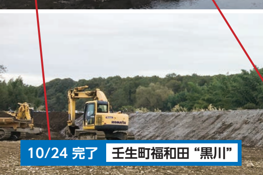
10/24 完了 壬生町福和田 "黒川"