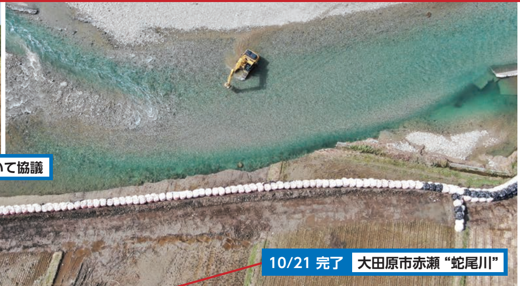
10/21 完了 大田原市赤瀬 "蛇尾川"