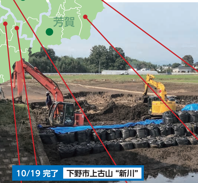
10/19 完了 下野市上古山 "新川"