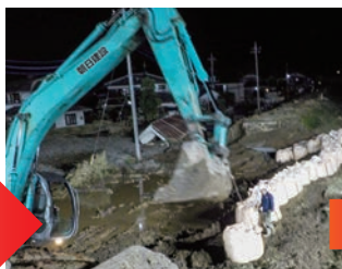
10月13日 19時 住宅地への水侵入防止措置