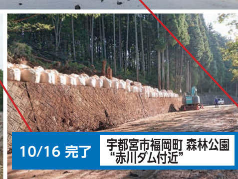
10/16 完了 宇都宮市福岡町 森林公園 "赤川ダム付近"