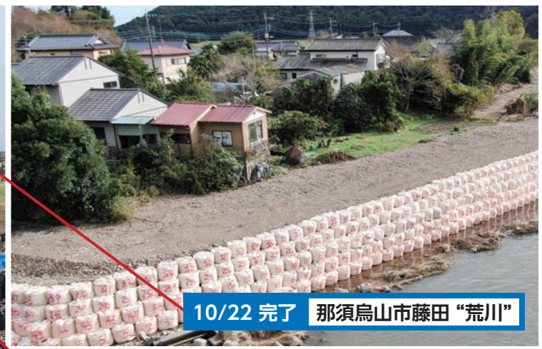
10/22 完了 那須烏山市藤田 "荒川"