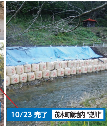
10/23 完了 茂木町飯地内 "逆川"