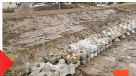
10月18日 応急対応完了

佐野市赤坂町の海陸橋近くの「秋山川」が決壊。安蘇支部会員企業が、昼夜を問わず迅速な対応により住宅地へ流れ込む水流の侵入防止措置を行う。再び雨脚が強くなる前に応急対応が完了し、防水シートを覆った。