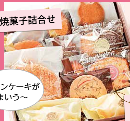
レモンケーキが まいう~