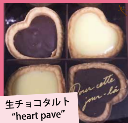
生チョコタルト "heart pave"