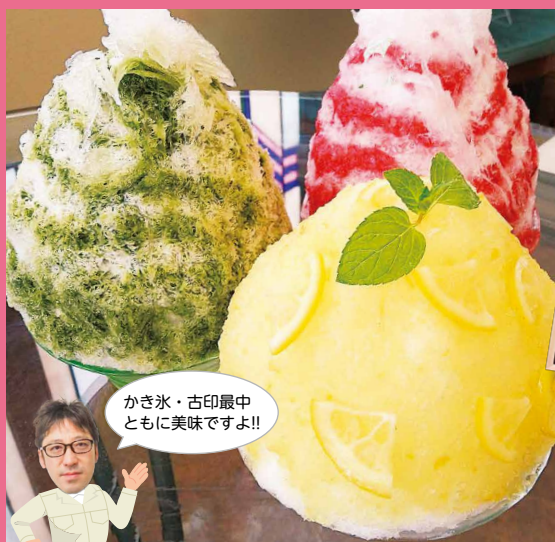
かき氷・古印最中 ともに美味ですよ!!

世界遺産の街、日光の中心部に位置するひときわ大きな凧の看板が目印のお店です。近くには日光東照宮をはじめ、日光山輪王寺、日光二荒山神社等、数々の名所があります。お店には多くの外国人観光客が訪れ、旅の記念のイラストやメッセージが店内壁一面に広がります。外国人に大人気の焼き鳥やモチモチの麺にソースが絡んだ焼きそば、そしてみんな大好き揚げたて熱々の唐揚げがご飯と一緒にワンプレートでいただけます。また、ベジタリアンメニューやアレルギーに対応したお料理も用意しておりますので、お気軽にお申し付けください。明るい女将さんが元気に対応してくれます。日光散策で小腹がすいたら、ぜひお立ち寄りください。