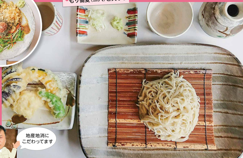
地産地消に こだわってます