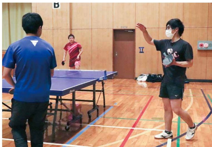
試合前のアドバイスをしている場面です。

もちろん仕事が遅くなってしまい、きりよく終わらない時もあります。だからこそ、仕事とプライベートその二つのメリハリをつけるのが大切だと思います。