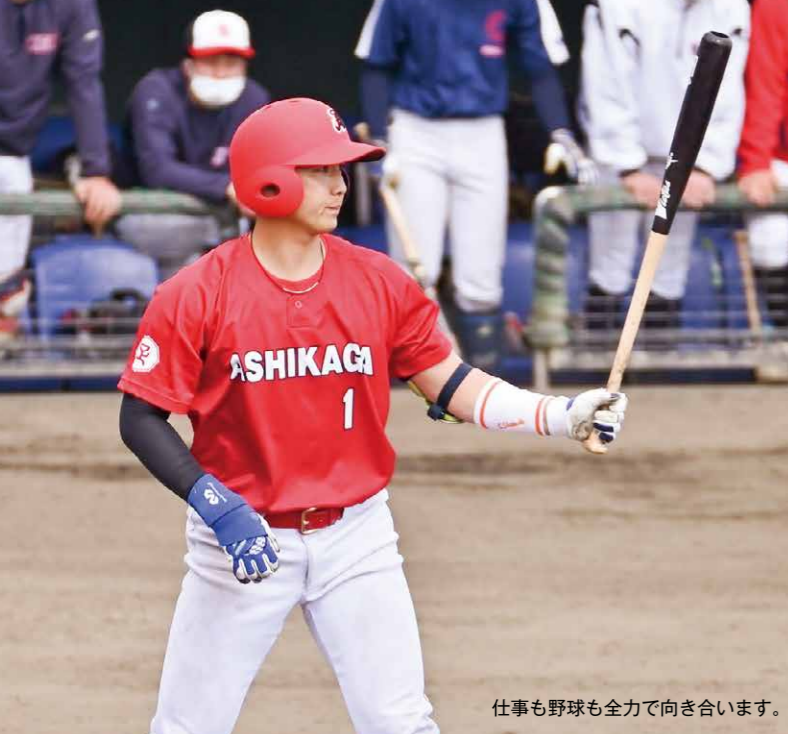
仕事も野球も全力で向き合います。