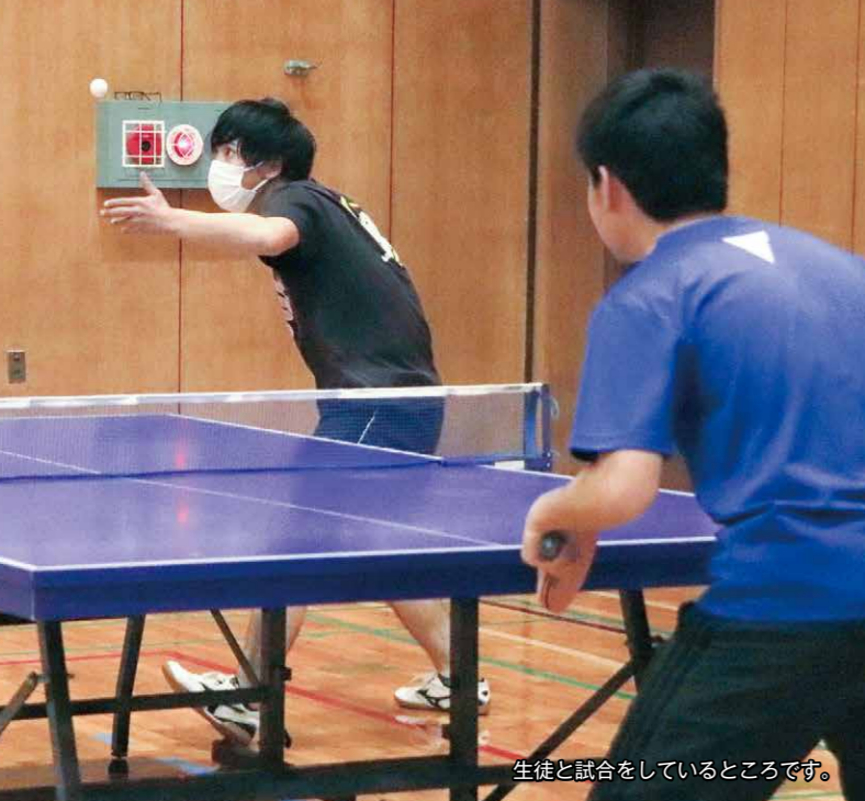
生徒と試合をしているところです。