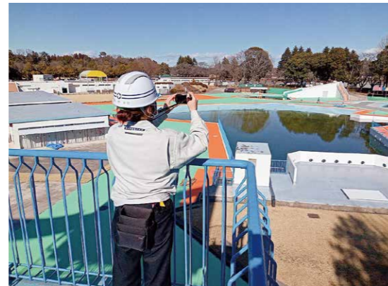
たくさんの人々が使うプールの改修もしています。

そのため、あまり聞き慣れない言葉や工法などに戸惑うことや難しい建築の知識に悪戦苦闘の日々ですが、先輩や上司の方々が優しく教えてくださったり、現場では