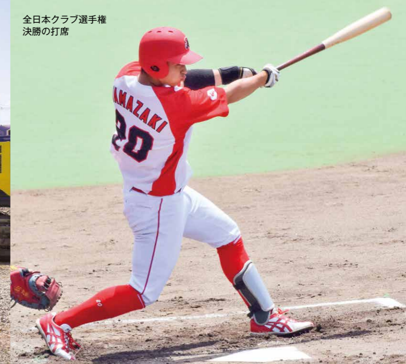
全日本クラブ選手権決勝の打席