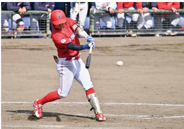
試合は2安打2打点でした。

—仕事とプライベートを両立するコツを教えてください。 仕事も野球も100%という気持ちでは過ごしていますが、「両立しよう」と考えたことはありません。どちらも生活の一部で、しっかりやって当たり前というような考えです。中途半端になってしまえば、時間も無駄にし、自分も損してしまう気持ちになります。