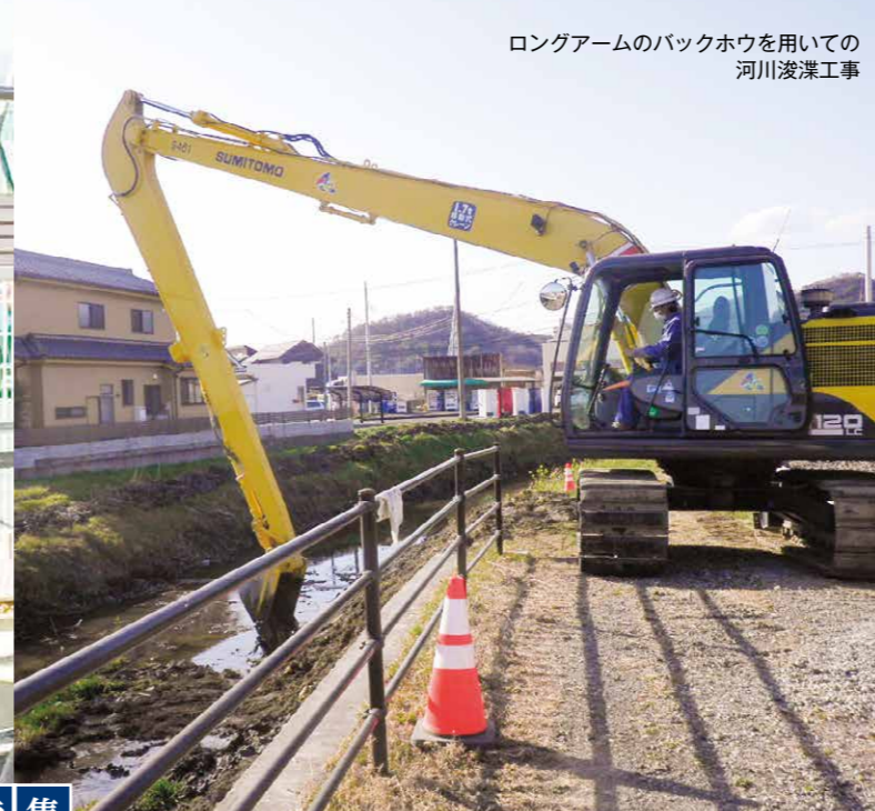
ロングアームのバックホウを用いての河川浚渫工事