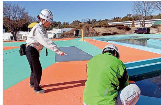
業者さんとコミュニケーションを取りながら作業しています。

私は、高校卒業後に松本建設㈱に入社し今年の4月に2年目を迎えます。幼い頃からものづくりが好きだった私は、休日はミニチュアやマスコット作りをよくやっていました。