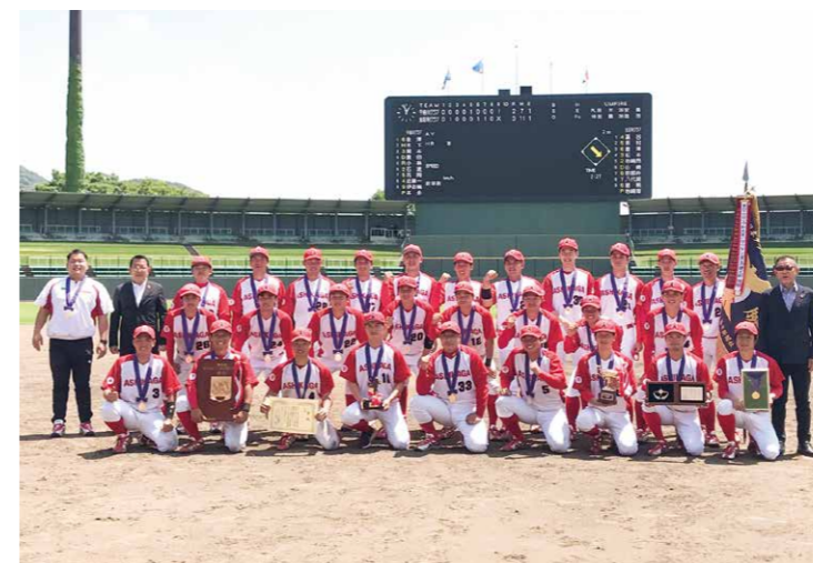
全日本クラブ選手権優勝

もちろんですが一つをこなすより、二つをこなすほうが難しいと思います。しかし、それ以上に達成感ややりがいを得られることもあります。その小さな達成感、やりがいに取り組むことが生きがいにつながると思います。難しいことだとは思いますが、ぜひチャレンジしてみてください。