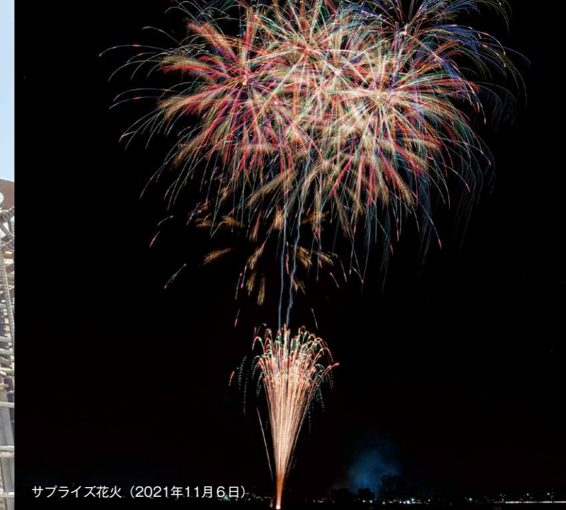
サプライズ花火 (2021年11月6日)