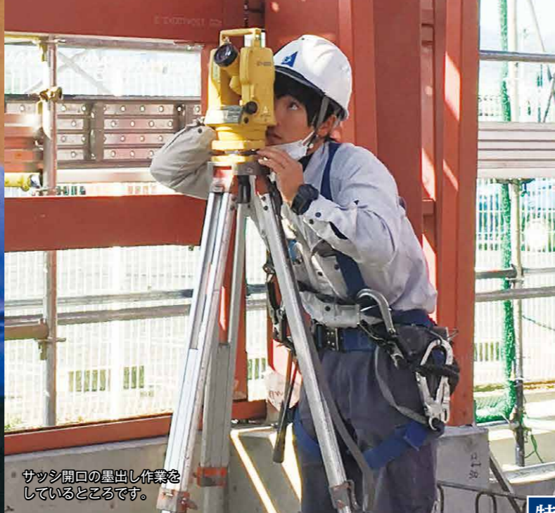
サツ開口の墨出し作業をしているところです。