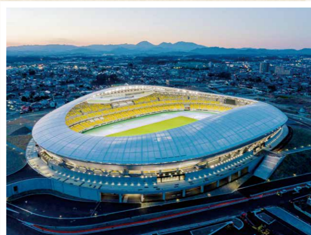
⑨ 令和2年 総合スポーツゾーン「新スタジアム」竣工