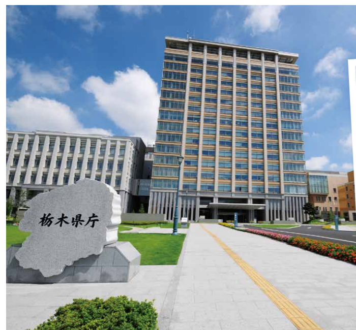
⑦ 平成19年 栃木県庁竣工