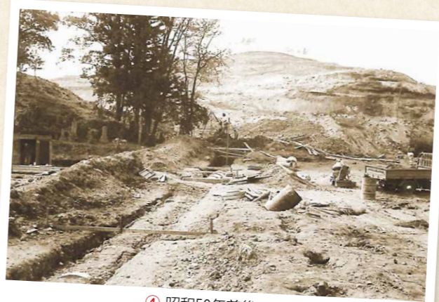
④ 昭和50年前後 宇都宮市北山霊園排水