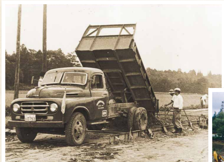
③ 昭和32年 国道4号 塩谷郡阿久津町（現・高根沢町）舗装新設工事