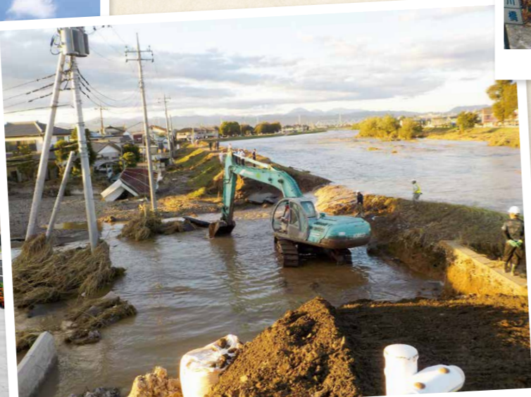
⑧ 令和元年 台風19号による災害復旧