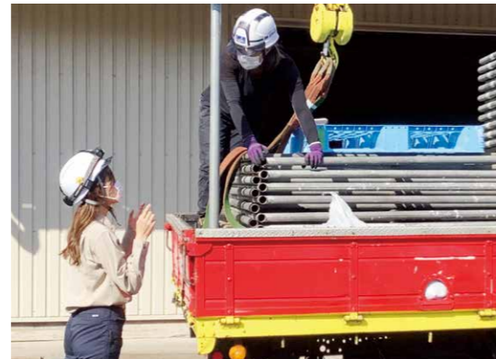
女性の作業員さんと打合せ中

最初は表面だけのイメージだった「カッコいい」という言葉が、たくさんのご経験を、学び、成長するにつれて、日に日に重みを増してきているように感じます。「カッコいい」仕事の裏側には、数えきれないほどの責任があり、プレッシャーがあり、苦悩があります。それを乗り越え、現場が竣工した時の達成感、今までに感じたことのないものでした。どの現場を終えた時にも、反省点は多々あるのですが、「カッコいい」仕事をしたと思