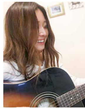
趣味で始めたギターは4年目です

建設業は男性が多い業界だからこそ、女性の強みを存分に活かせるシーンもたくさんあります。「女性の監督さんの現場だと、事務所もトイレもきれいでいいね」と喜ばれるのも、女性ならではののかもしれません。今では現場で活躍する女性も増えてきています。これから建設業を目指す女性たちに希望を与えることができるように、「カッコいい」仕事を続けていきます。