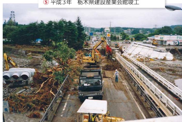
⑥ 平成10年 那須水害による災害復旧