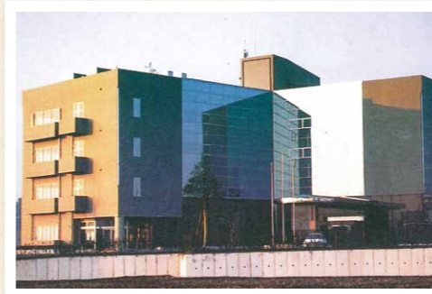
⑤ 平成3年 栃木県建設産業会館竣工