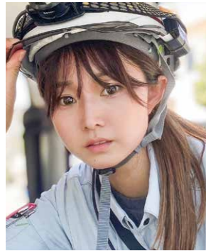
今日も安全作業で頑張ります！

大きな建物や構造物を築き上げる建設業は、社会貢献度が高く、その建物が数十年以上の長きにわたって残り続けるという、スケールの大きい仕事ができる魅力があります。そんな世界に憧れて、専門学校に入学し、建築を学びました。それからミユキ建設に入社し、今に至ります。