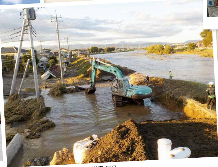
⑧ 令和元年 台風19号による災害復旧