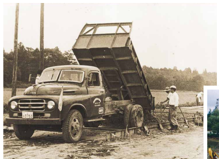
③ 昭和32年 国道4号 塩谷郡阿久津町（現・高根沢町）舗装新設工事