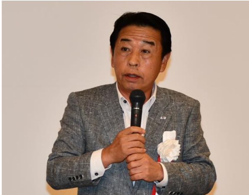
■ 副会長 閉会のことば