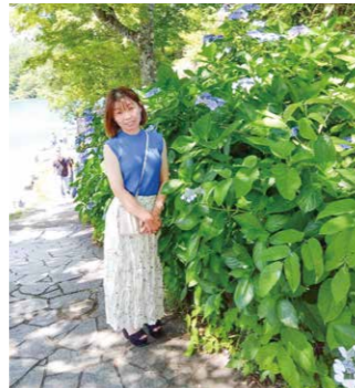
夏は避暑地でのんびり過ごします。