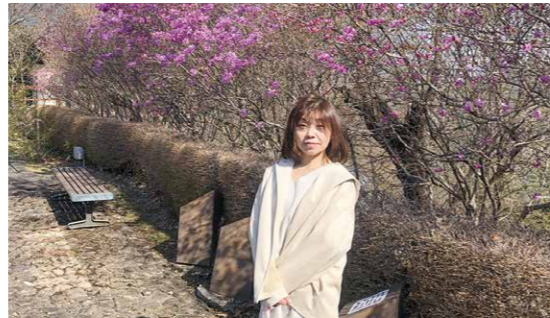
春は公園で散歩がお気に入りです。

若い世代から選ばれる魅力的な職場を目指すためには、衛生面の拡充はもとより、男女平等の給与体系やおしゃれな職場、おしゃれな作業着などもイメージアップに効果的だと思います。そしてこれからの若い世代が土木について興味を抱くような斬新で魅力的な体制が一刻も早く整備されることを切に願います。