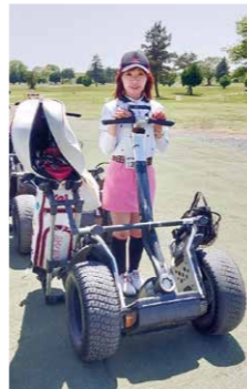
セグウェイに乗りたくて、たまにゴルフに行きます。