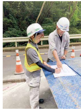
協力会社の現場代理人さんと打合せです。わからないことを質問すると快く教えてくださいます。

子供たちが成長した最近になってようやく、土木施工管理技士1級の勉強をさせていただく機会を与えられました。勉強中は今まで仕事をしていてもよくわからなかった建設業や安全衛生法についても学ぶことができました。そして何より心強かったのは、私を応援してくだ