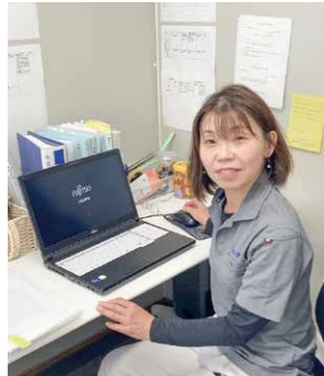
現場事務所で書類を作成します。

私がパート事務として入社したのは子供を幼稚園に通わせていた頃のことでした。幼稚園の行事が多く休みがちでしたが、会社の親切な計らいにより私の生活スタイルに合わせて働くことができたため、なんとかここまで続けてこれました。