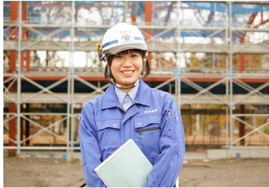
いつも笑顔でいることを心掛けています

建築に興味を持ったのは、幼馴染の家の丸い屋根が気になったからでした。学生時代は設計の授業が好きでしたが、就職活動の際、施工管理という仕事を知りました。より良い建物を建てるには、施工管理が重要だと思ったこと、建築を生かして地元を発展させたいと思ったことで、板橋組に就職しました。