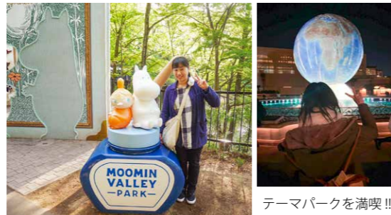
テーマパークを満喫!!

建設業は、男性社会の印象だと思いますが、入社当初に同じ現場だった先輩や職人さん、資材の運転手さんなど、現場で女性に出会うこともあります。現場で働くことで女性技術者に興味を持ってもらえたり、職人さんたちにもっと気を配れたりしたらいいなと思いました。そしていつか、特集で“現場で働く女性”が企画されないくらい建設業にも女性が増えることが、私の夢です。