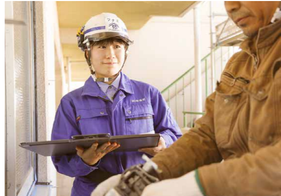
職人さんとコミュニケーションをとりながら作業をしてもらっています

2年間で新築3件、改修1件を経験してきましたが、現場を采配する大変さを感じるとともに、ご指導いただく上司や協力業者さんへ尊敬・感謝を感じます。気さ