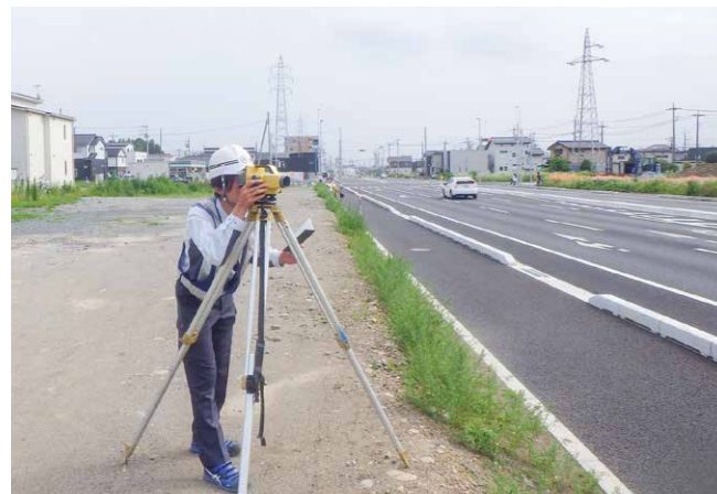
工事を完了し、出来形測量を実施しています。

特に苦労したことは、初めて現場代理人として従事した交差点部の舗装工事です。道路規制が複雑であったこと、住宅街での工事であったため気を使いました。また、夜間の作業でしたので、安全管理にはより配慮しました。