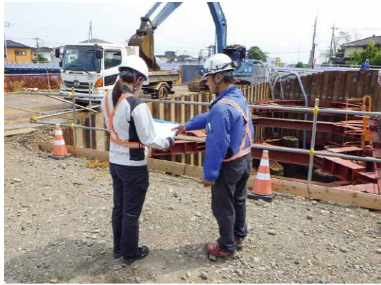
現場に足を運んで工事の様子を見ることが楽しみの一つです

私が山菊開発に入社したのは、息子が1歳を過ぎて保育園に入園したタイミングでした。仕事探しをする中で、初めから建設業を希望していたわけではなく、仕事と子育ての両立が叶う職場を探していました。そんな時に出会ったのが山菊開発でした。建設業についてはほぼ無知に等しい状態でしたが、面接時に社長と話し、この会社で働いてみたいと感じたことを覚えています。