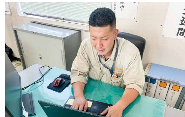
事務所内での書類作成

現場に携わる様々な人々と協力をして、工事を完成させるという目標に向かっていくところです。