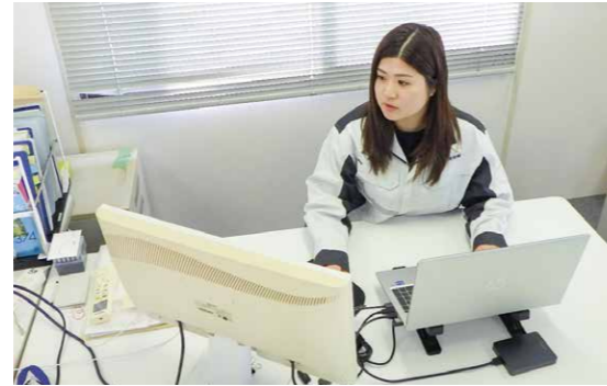
現場事務所にて、デスクワークもしています

初めの頃は、先輩方の業務の初歩的な部分の手伝いから始まり、徐々に業界の用語に慣れていくために上司が工事の設計書の見方を解説して教えてくれたり、過去に手がけた工事の書類を見て勉強したりと、そんなスタートでした。本社で過ごした数か月間で、先輩方の現場代理人としての責任感や姿勢、工事に関わる方々への細やかな配慮などを見せてもらい、たくさんのことを学びました。