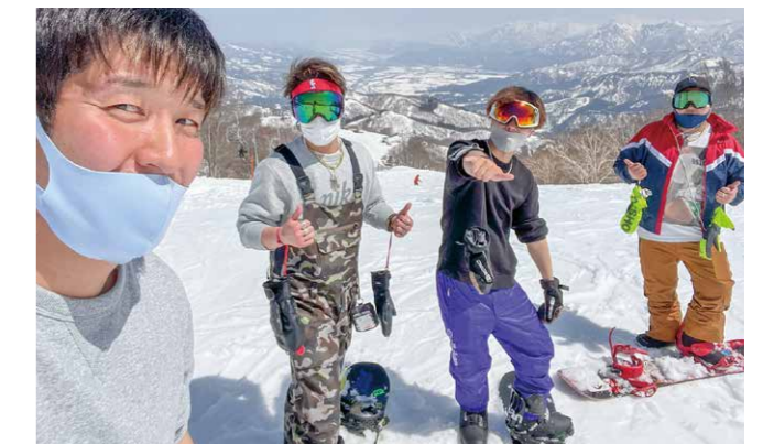
休日は、よく友人とグレンデにスノーボードをしに行っています

栃木県の建設業界で働く方々の記事を拝見しており、私もより一層頑張らなくてはと励みになっております。食べることが好きなので、もちろん、グルメスポットも毎回拝見しております。