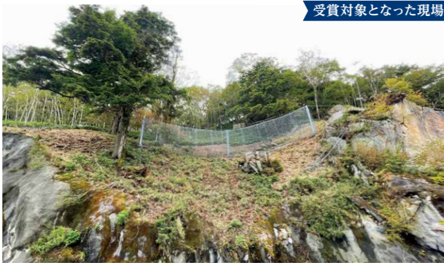
受賞対象となった現場