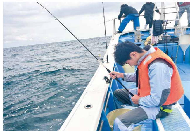
プライベートで友人と出かけた船釣りの時の写真です。アウトドアは好きですが船酔い気味です。

建設業界の方々のインタビュー記事や座談会の記事など、いつも拝読しています。皆さまのご活躍は私にとっても励みになっています。