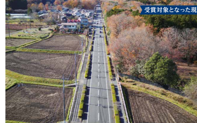
一般県道 日光だいや川公園線の舗装修繕工事完成写真