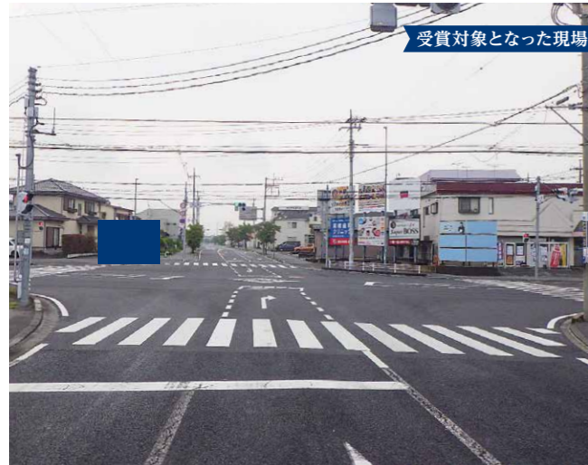
受賞対象となった現場