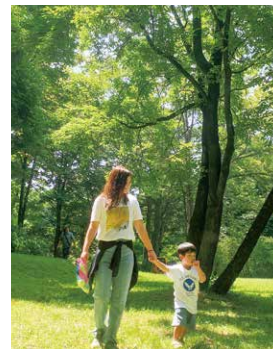
休みの日は息子と一緒に公園へ遊びに行きます