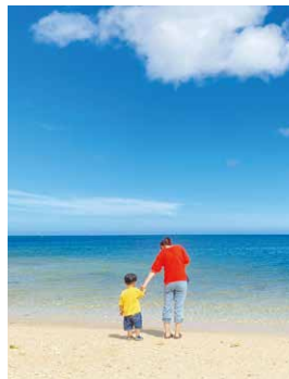
家族旅行でキレイな海を満喫しました

入社して1年3か月が経ちました。まだまだ先輩方の存在に助けられてばかりの日々ですが、理解ある会社や上司・先輩方のおかげで、子育てと両立しながら楽しく働くことができている。建設業は男性社会のイメージが強いといわれますが、こうして私のように楽しく働いている女性もいるということがもっと広く伝われば嬉しいです。