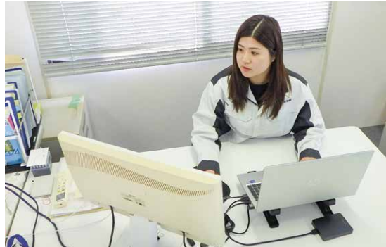
現場事務所にて、デスクワークもしています

初めの頃は、先輩方の業務の初歩的な部分の手伝いから始まり、徐々に業界の用語に慣れていくために上司が工事の設計書の見方を解説して教えてくれたり、過去に手がけた工事の書類を見て勉強したりと、そんなスタートでした。本社で過ごした数か月間で、先輩方の現場代理人としての責任感や姿勢、工事に関わる方々への細やかな配慮などを見せてもらい、たくさんのことを学びました。