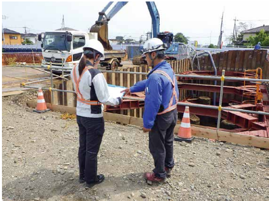
現場に足を運んで工事の様子を見ることが楽しみの一つです

私が山菊開発に入社したのは、息子が1歳を過ぎて保育園に入園したタイミングでした。仕事探しをする中で、初めから建設業を希望していたわけではなく、仕事と子育ての両立が叶う職場を探していました。そんな時に出会ったのが山菊開発でした。建設業についてはほぼ無知に等しい状態でしたが、面接時に社長と話をし、この会社で働いてみたいと感じたことを覚えています。