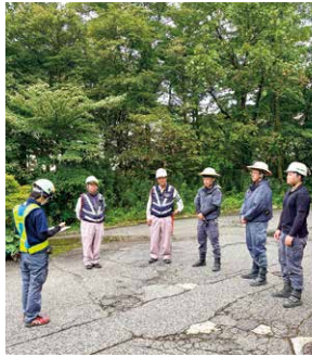
朝は元気に朝礼をします

これからの目標はたくさんありますが、特にやり遂げたいものが二つあります。まずは2級土木施工管理技士の取得です。今年の秋に実地試験が控えているため、日々の業