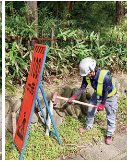
先輩に協力してもらいながら看板立ても行います

務と並行して勉強に取り組んでいます。資格を取ることで自分の自信につながるだけでなく、任せられる仕事の幅も広がり会社により貢献できると考えています。ありがたいことに会社からテキストなどを用意していただいているので、それを最大限に活用し、万全の状態ですべてに挑みたいと思います。