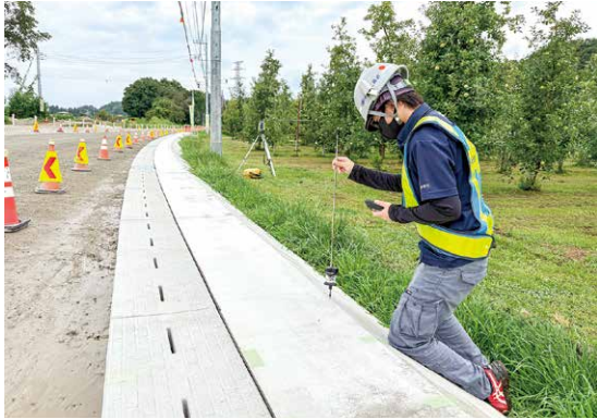
現場では測量を行うことが多いです

私が入社したのはコロナ禍の真っ只中でした。当時はコロナの影響で求人も少なく、女性ということもあって採用していただけるのか不安だったのを覚えています。