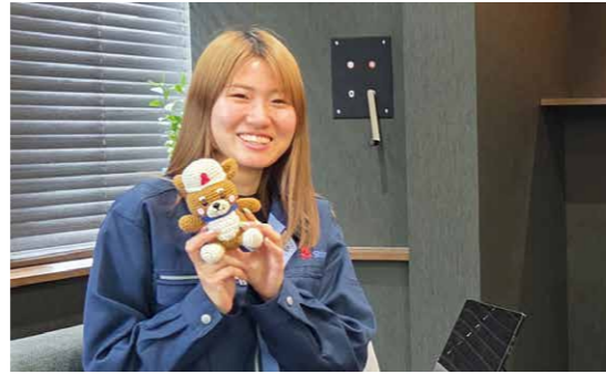
会社マスコットのシバニャンです！

柴田建設では、女性や若手社員が働きやすい環境づくりに力を入れています。完全週休二日制の導入、本社改修、DX化の推進など、良いと感じた取り組み