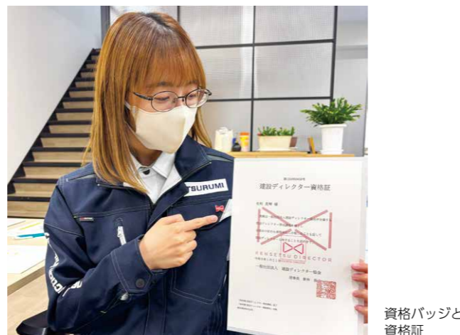
資格バッジと資格証

将来的には現場代理人の方の書類作成業務のうち約6割を建設ディレクターとして請け負うことができれば良いと考えています。そのためにも、「いつ、どの書類が必要かを考え、自ら相談・準備すること」「業務の幅を広げていくため、たくさんコミュニケーションを取り、頼みやすい環境・雰囲気づくりをすること」を今の目標としています。