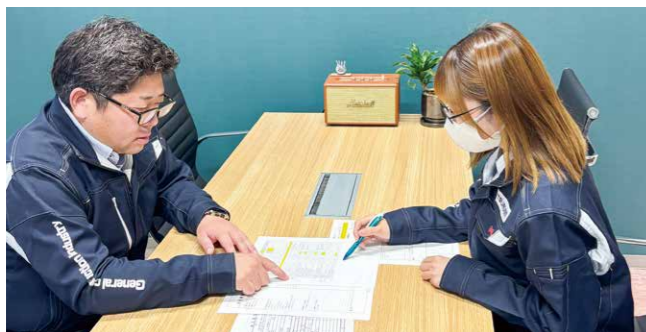
社長と見積り打ち合わせ

会社初の試みである「建設ディレクター」として採用していただきましたが、建設業は未経験です。「今後ディレクター業務を一から確立していくためには知識が必要だ」という社長の後押しもあり、基礎知識や建設ディレクターについて学ぶために受講する運びとなりました。資格は「建設ディレクター育成講座」を受講し、試験に合格すると得ることができます。