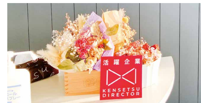
本社入口ステッカー

今後は建設ディレクターとしてさらに知識と経験を積み、現場をより円滑に支えられる存在になりたいと考えています。また、書類業務の効率化やデータ管理の改善などにも取り組み、現場の負担軽減につながる仕組みづくりにも関わっていききたいです。