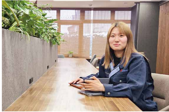
新しく、きれいになった事務所で書類作成などをしています。

学校で学んだことを実際の現場で活かしたいという思いから、現場監督を志望しました。私が入社する前は女性や若手社員が少なく、不安もありましたが、「まずは挑戦してみよう」という気持ちで入社を決意しました。入社当初は年齢が離れた方が多く、声をかけることにも勇気が必要でした。それでも現場で経験を重ねるうちに少しずつコミュニケーションが取れるようになり、今では職人さんとのやり取りもスムーズに行えるようになりました。