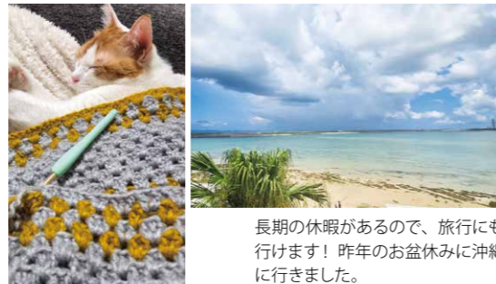
最近の趣味は編み物です。

性別、年齢に関係なく、誰もが安心して挑戦できる環境をこれからもつくっていきたいです。これまで支えてくださった方への感謝を忘れず、次は後輩の背中をそっと押せる存在になりたいと思います。